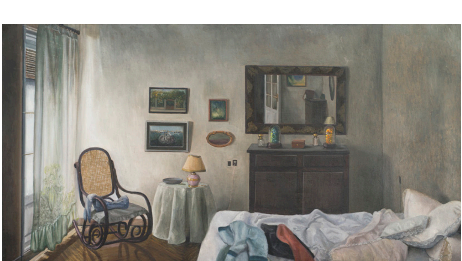
La casa de Cristina, 1983. Óleo sobre tabla. Colección Cristina Alberdi. Amalia Avia © VEGAP, Madrid 2022.

En el archivo, además, la autoría cuenta, pero solo hasta cierto punto. En los archivos rigen otros valores, si bien el archivo –ocurre en tantas ocasiones con las propuestas de registro- termina por estar íntimamente ligado a la autobiografía de los propios autores. De hecho, vistas desde esta perspectiva, las obras de Avia podrían entenderse como cierta serialidad que funciona no tanto como reiteración sino como colección de colecciones. Además, el archivo es, en primer lugar, un domicilio; una casa para los retazos de tiempo y espacio; el lugar donde las partes buscan al todo y los fragmentos dispersos se reúnen en una luminosa historia. Los archivos tienen mucho de “casa”, de residencia, de “lugar donde”, de “allí donde”, se diría parafrasando a Jacques Derrida en su conocido libro Mal de archivo .