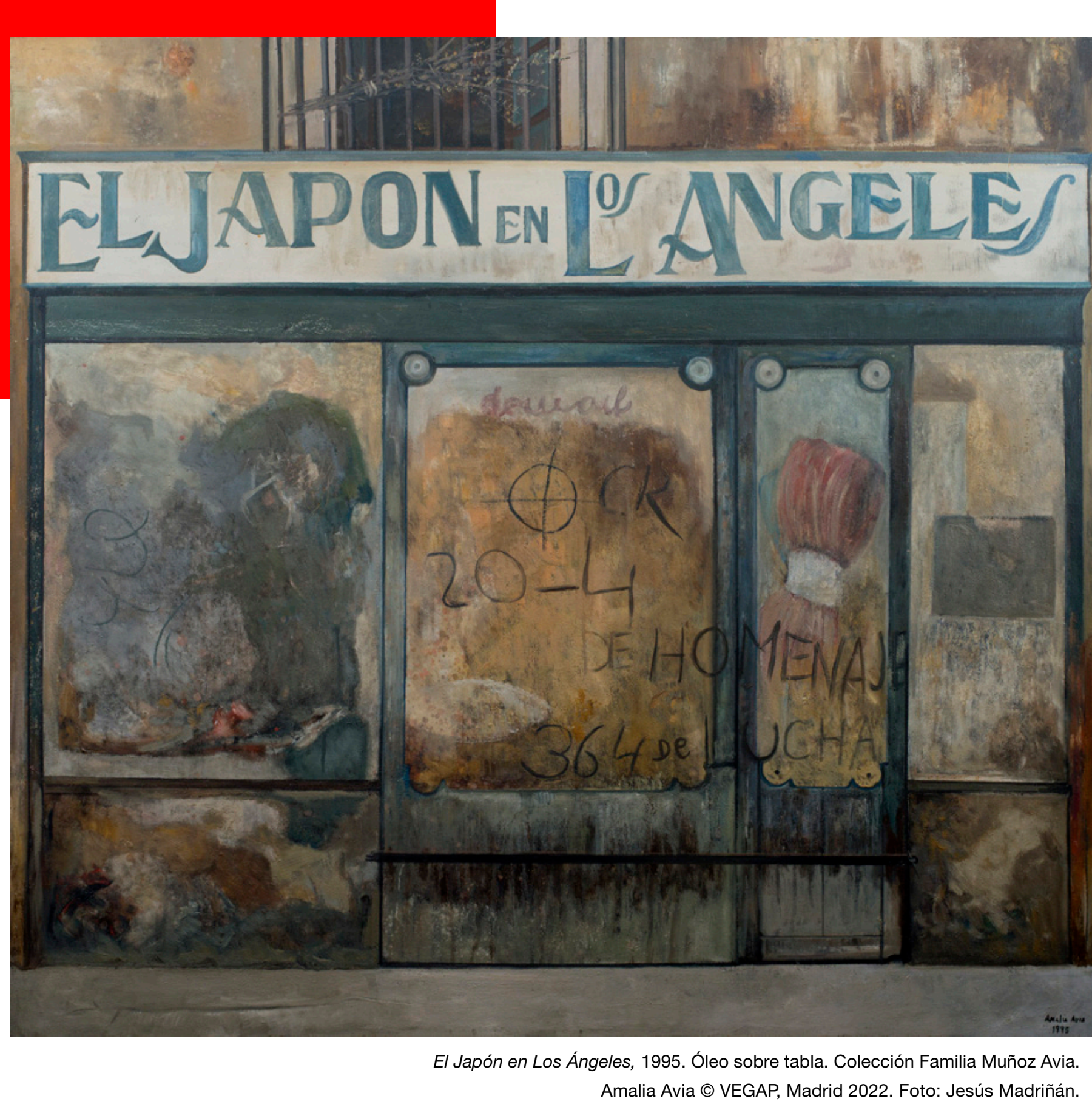
El Japón en Los Angeles, 1995. Óleo sobre tabla. Colección Familia Muñoz Avia. Amalia Avia © VEGAP, Madrid 2022.