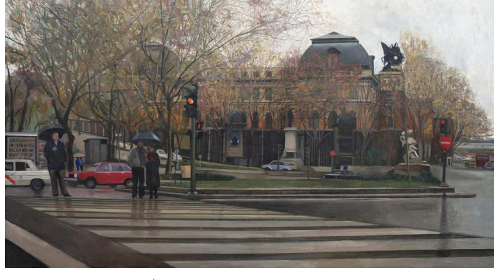
Ministerio de Fomento, 1988. Óleo sobre tabla. Colección Familia Muñoz Avia. Amalia Avia © VEGAP, Madrid 2022.