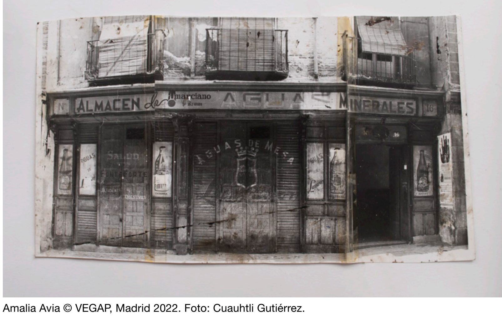
Amalia Avia © VEGAP, Madrid 2022.

“Pinto lo que no puedo fotografiar. Uso la fotografía únicamente como modelo. Si son temas de Madrid, hago una fotografía y luego me acerco varias veces a ver el lugar mientras lo pinto. Si el lugar no es Madrid lo que pinto está basado en los recuerdos que me traigo. En cambio, mis compañeros realistas pintan del natural. Está muy bien pintar del natural, pero cada uno tiene su método y costumbres.” Estas palabras de Amalia Avia (Santa Cruz de la Zarza, Toledo, 1930 – Madrid, 2011) pueden estar contando mucho más de lo que aparentan a propósito de una creadora durante años considerada “realista”, por el simple hecho de no ser abstracta y ser figurativa. Pero, ¿es Amalia Avia una simple “pintora realista” o su propuesta artística es mucho más compleja? Sobre todo, ¿qué es lo que pinta Avia al no poder fotografiarlo?