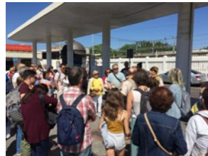
2 De como muestra vale un botón. Introducción amenizada por los personajes en el interior del tren. Viaje de ida.