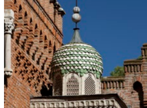
3 De cómo Alcalá es un crisol de culturas y el tren se volvió centro de la ciudad. Estación central de Alcalá de Henares. Paseo de la Estación (Palacio Laredo). Maslama Al Mayriti y María Isidra de Guzmán.