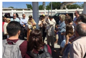
1 De cómo vociferar en una estación de tren. Vestíbulo de la Estación de Atocha-Renfe. Miguel de Cervantes y María Isidra de Guzmán.