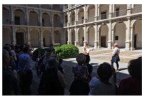
13 Universidad-Colegio Mayor de San Ildefonso. María Isidra de Guzmán y Juan el Estudiante.