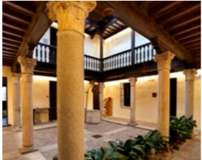
6 De cómo hay muchos soportales. La calle Mayor es la Mayor. Calle Mayor (Hospital de Antezana y Casa de Cervantes). Calle Imagen (casa de la Calzonera, casa natal de Manuel Azaña y Convento de la Imagen). Sancho Panza y Pilar la Coja.