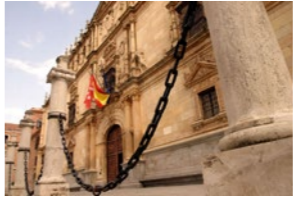
14 De cómo los viajeros se convierten en estrellas de la actuación. Plaza de San Diego. Don Juan Tenorio y Doña Inés.