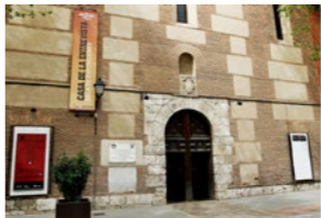
9 De cómo no se dio la entrevista en la Casa de la Entrevista. Plaza del Palacio (junto a Casa de la Entrevista). Varios personajes.