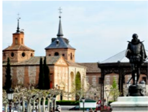
15 Tren de regreso. Estación central de Alcalá de Henares.