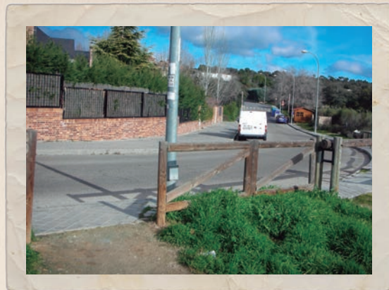
Punto donde acaba el tramo asfaltado. Urbanización El Monte.