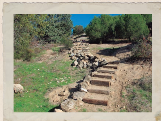
Tramo de subida a la Presa del Embalse de Los Peñascales.