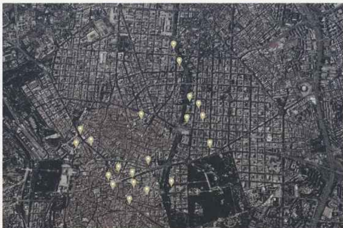
RUTA 01: EL CAMINO DE LAS LUCES