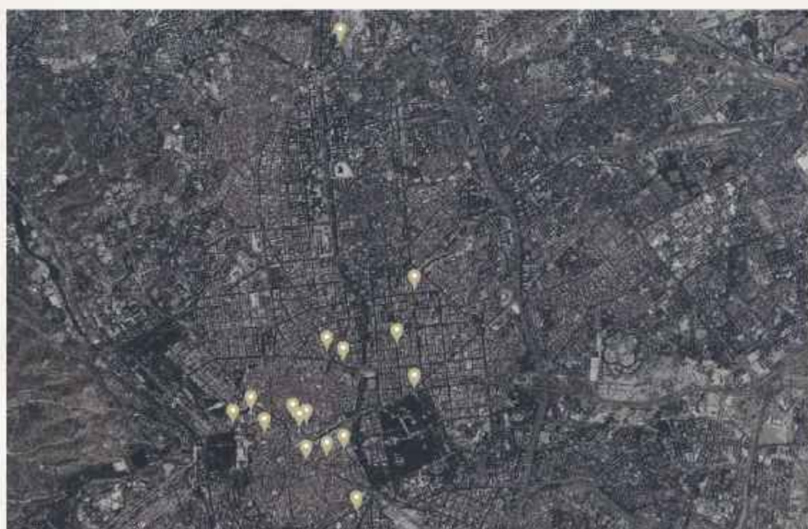
RUTA 02: LUZ Y MAGIA NAVIDEÑA